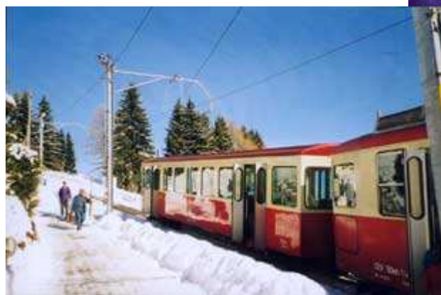
Le train Vevey – Les Pléiades, lieu des compétitions de ski de fond