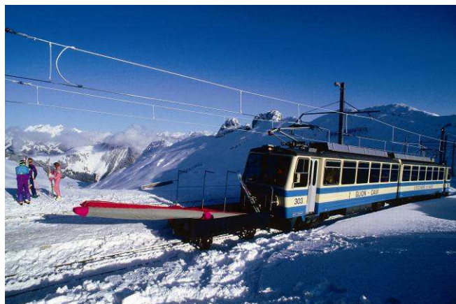
Le train Montreux - Les Rochers de Naye au terminus des Rochers-de Naye, à 2000 mètres, lieu des compétitions de ski, snowboard et freestyle

Sur place, les déplacements aux lieux de compétitions sont prévus par train (Vevey-Pléiades, Montreux-Rochers-de-Naye, funiculaire Les Avants-Sonloup) et par mini-bus de location.