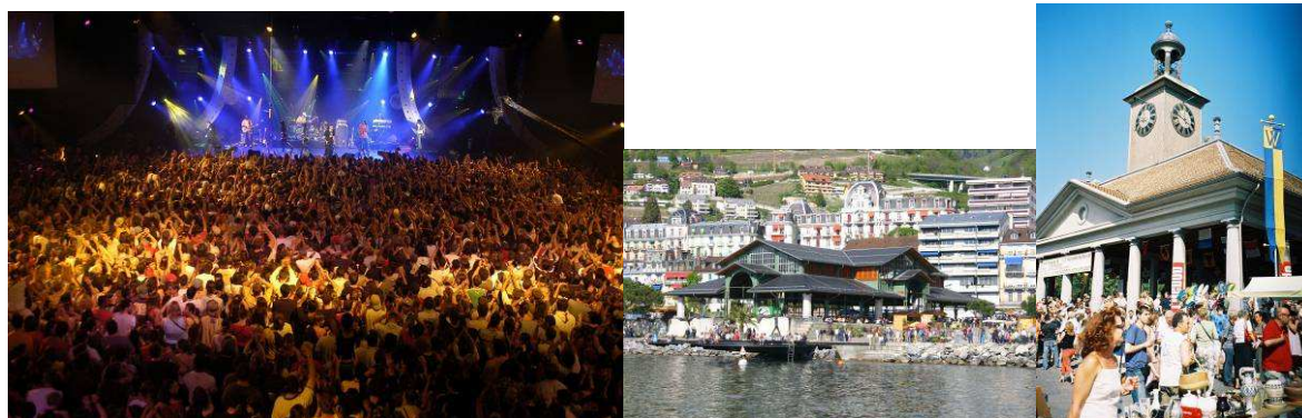
Le magnifique Auditorium Stravinski lors du fameux Montreux Jazz Festival, le Marché couvert de Montreux et la Grenette de Vevey : lieux de fêtes.

Les cérémonies d'ouverture et de clôture, ainsi que de remise des médailles, sont régies notamment par les articles 8 et 9 des Statuts ICG. Des collaborations avec les saisons culturelles et les communes de Montreux et de Vevey sont possibles afin de prévoir en synergie des opérations groupées.