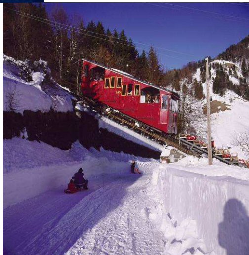
Le funiculaire Les Avants – Sonloup et la piste de luge naturelle sur route