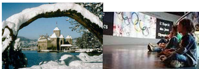
Visites culturelles en particulier au Château de Chillon et au Musée du Comité international olympique

Différentes visites et rencontres culturelles sont à prévoir. La richesse culturelle de la Riviera, avec notamment le Château de Chillon, ainsi que celle de Lausanne avec notamment le Musée du CIO, facilitera l'organisation de ces événements et visites.