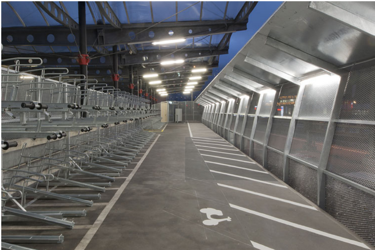
Vélostation veveysanne