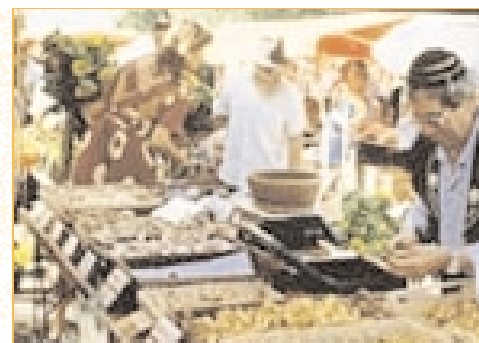
Des produits régionaux et de saison tout près de chez soi.

Agenda 21 a établi le «Panorama des producteurs et détaillants proposant des produits régionaux» sur la base d'un sondage dans le district de Vevey pour les détaillants, et dans les districts de Lavaux, Aigle et Vevey pour les producteurs.