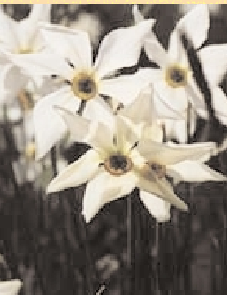
Le narcissus des poètes fleurit en mai sur les hauts de la Riviera vaudoise.

Au niveau fédéral, on étudie actuellement la possibilité d'accorder un soutien financier à la gestion de parcs naturels régionaux, afin de valoriser des patrimoines naturels et paysagers. Le Plan directeur régional de la Riviera a inscrit dans ses propositions d'action la création d'un parc préalpin. Cette démarche prend tout son sens dans l'optique d'une offre régionale de tourisme doux et d'une agriculture intégrée.