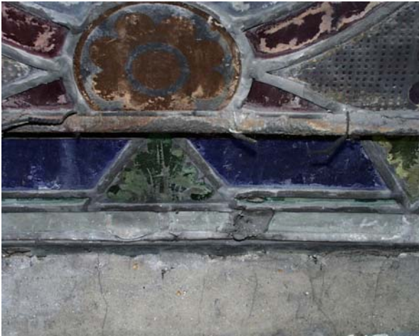
Etat de la serrurerie dégradée supportant les vitraux