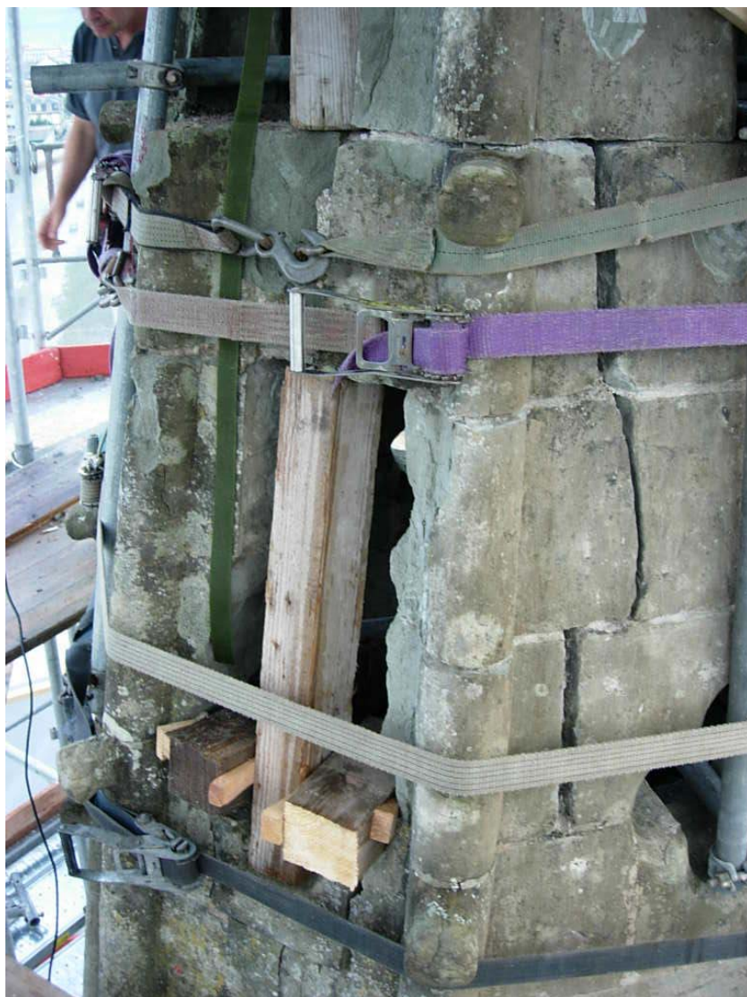
Mesures urgentes de sécurisation de la flèche du clocher après l'ouragan du 18 juillet 2005