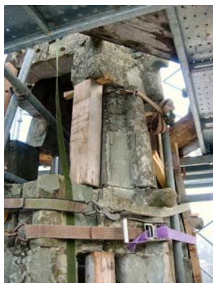
Mesures urgentes de sécurisation de la flèche du clocher après l'ouragan du 18 juillet 2005