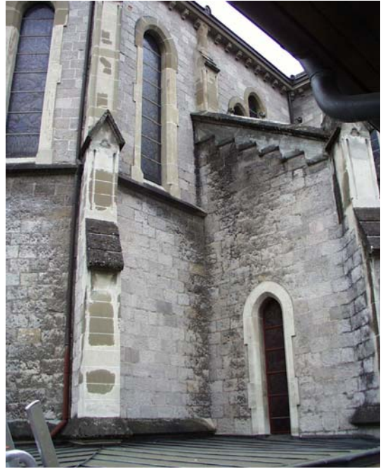
Etat des encadrements et des contreforts en molasse réparés en 1975 par de la molasse dite « synthétique » (parties claires)