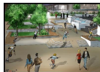
Figure 4 : Skate urbain St-Antoine

La pratique du skateboard ayant considérablement évolué ces dernières années, il est d'usage d'adapter les infrastructures et le mobilier urbain pour la pratique des sports à roulettes comme activité libre, dans un périmètre non défini et sans marquage particulier.