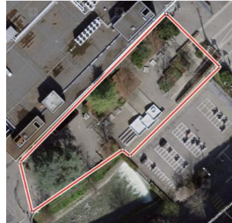
Fig. 2 : Site St-Antoine

Le but de ce préavis est également de répondre au postulat « en faveur d'un espace moderne en béton (skatepark) pour les sports à roulettes à Vevey », déposé par M. Jérôme Christen le 5.12.2013 en créant de nouvelles infrastructures destinées à la pratique de différents sports à roulettes tels que skateboard, patins à roulette, vélo (bmx ou monocycle) et trottinettes notamment.