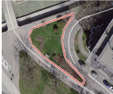
Fig. 1 : Site Veveyse

Le présent préavis a pour objet la création de deux sites dédiés aux sports à roulette, l'un au bas de la Veveyse, l'autre à l'est du Centre Saint-Antoine sur la place existante comme illustré ci-dessous.