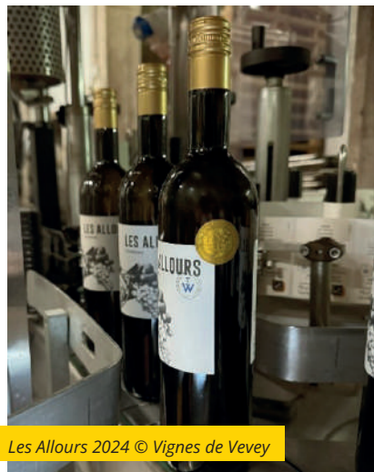
Les Allours 2024

Les vins mûris dans le vignoble communal viennent une nouvelle fois de s'illustrer dans plusieurs concours d'envergure. Ces distinctions mettent en valeur le travail de longue haleine de nos trois vignerons-tâcherons et confirment le savoir-faire et la qualité des crus de la Ville de Vevey, fruit d'un travail passionné et rigoureux.