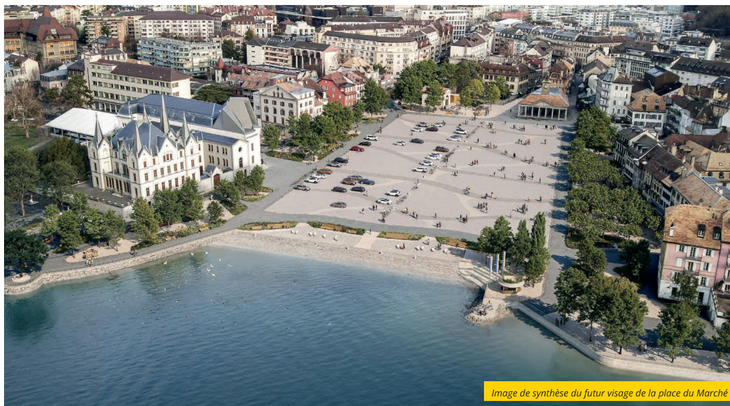
Image de synthèse du futur visage de la place du Marché