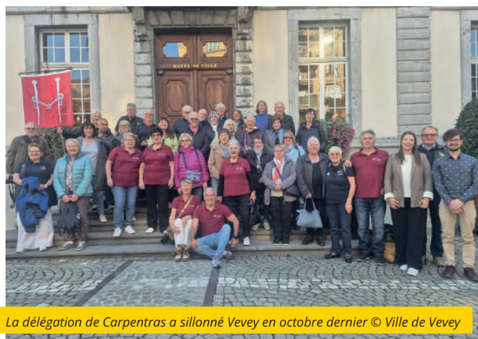
La délégation de Carpentras a sillonné Vevey en octobre dernier

Quarante ans plus tard, Vevey et Carpentras ont célébré les 40 ans de leur jumelage. Et si 450 kilomètres séparent les deux villes, plusieurs points communs les rapprochent : leur taille humaine, leur vie associative foisonnante, leur caractère touristique, leur riche patrimoine historique, et leurs foires automnales et séculaires : la Foire Saint-Martin à Vevey (554 e édition cette année) et la Foire de la Saint-Siffrein à Carpentras (500 e édition).