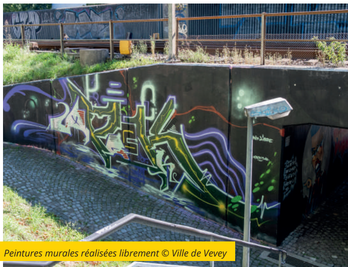
Peintures murales réalisées librement

Pour en savoir plus : www.vevey.ch/prestations/art-urbain