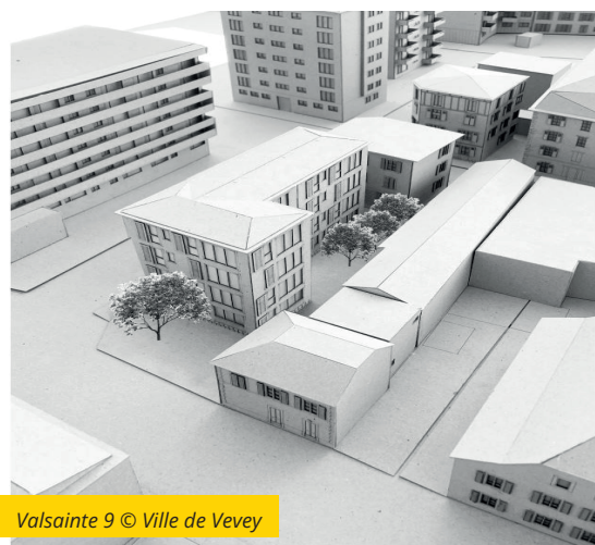
Valsainte 9