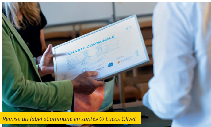
Remise du label «Commune en santé»

En obtenant trois étoiles, soit le niveau maximal du label « Commune en santé », la Ville de Vevey confirme son engagement en faveur de la santé et du bien-être de sa population, toutes générations confondues. Pas moins de 54 mesures ont ainsi été identifiées et validées par des expertes et experts partenaires d'Unisanté. Ces derniers ont salué les initiatives inclusives et solidaires, dont notamment les services de proximité ainsi que l'offre culturelle et sportive très riche proposée. Autres points forts : la politique de durabilité et l'engagement pour la santé au travail de notre Ville.