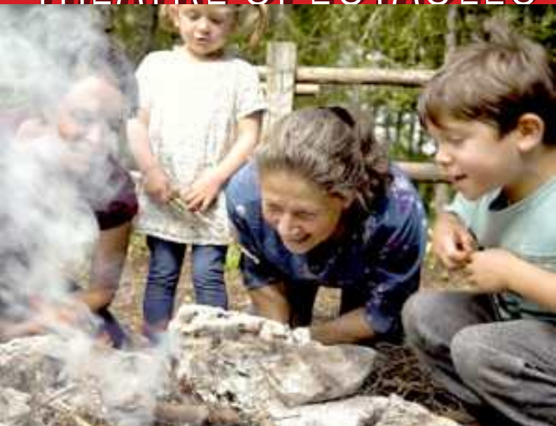
La Vallée (extrait)