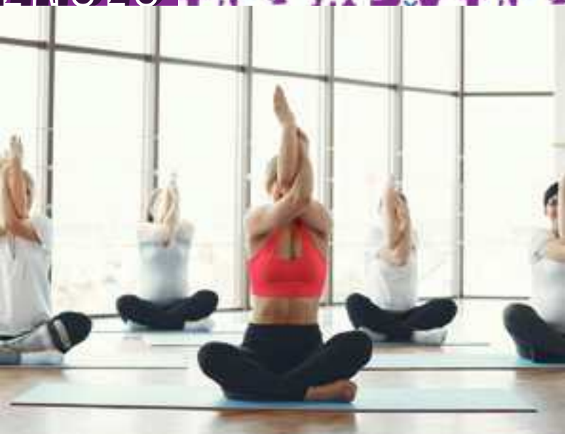
Cours de Yoga

08 JANVIER - 02 AVRIL (SAUF LE 19 FÉVRIER) je 18h - 19h