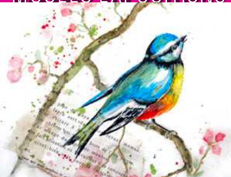
Œuvre d'Anne Cernigoi, un oiseau de passage

09 - 18 JANVIER lu-sa 7h - 19h, di 8h - 17h