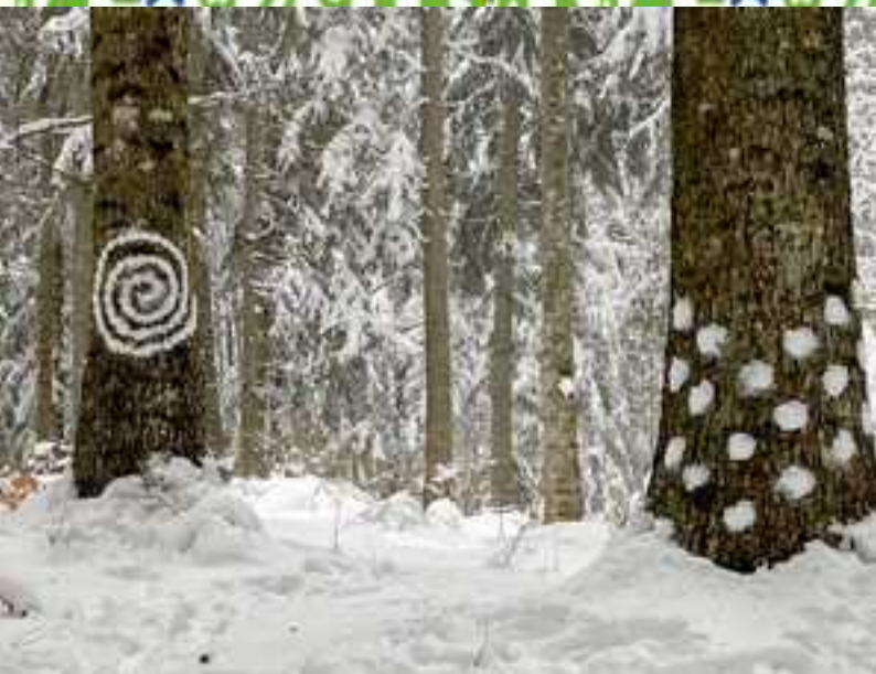
Forêt magique après le passage des artistes