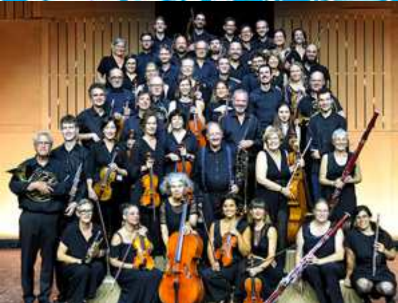
L'Orchestre de Ribaupierre