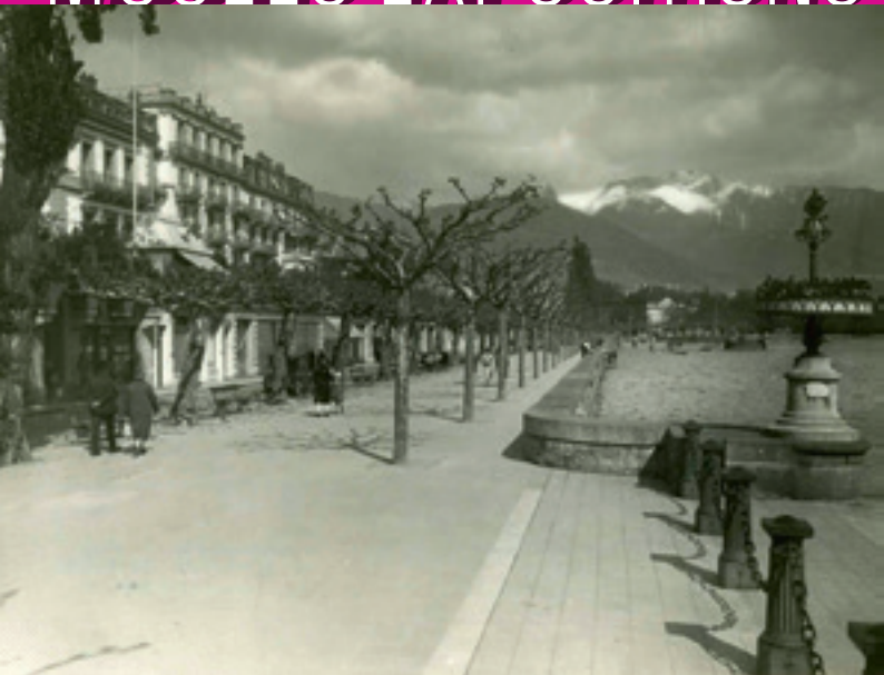
Le quai Perdonnet vers 1920

JUSQU'AU 04 OCTOBRE ma-di 11h - 17h (ouvert les lundis fériés)