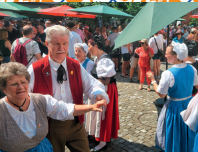
Groupe folklorique de La Tour - Le Vegnolan