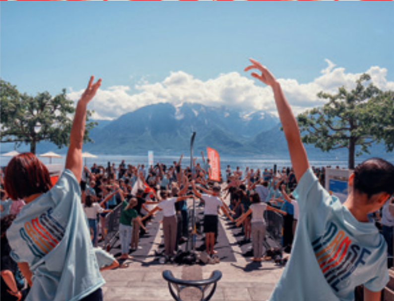
Giga Barre 2025