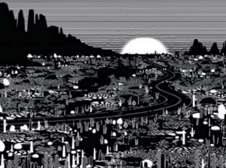
Frédéric Cordier, Swim 1, 2022, linogravure sur papier