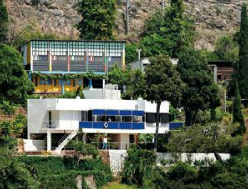
La Villa E1027, l'Étoile de Mer et le Cabanon à Roquebrune-Cap-Martin

JUSQU'AU 25 OCTOBRE ve-sa-di 11h-17h jusqu'à fin septembre / sa-di 14h-17h en octobre