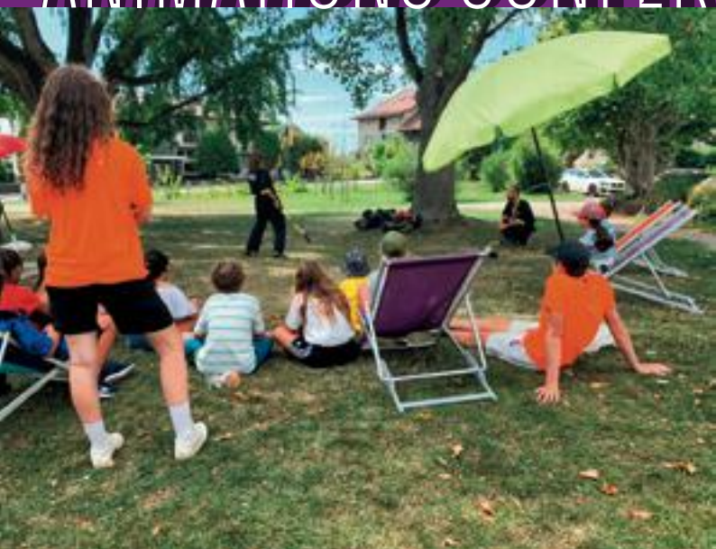
Atelier nunchaku au Parc Chaplin

10 - 13 AOÛT dès 15h, puis animation spéciale à 16h30