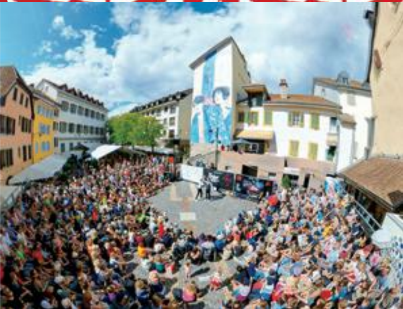
Le Cœur de la Fête sur la Place Scanavin

14 + 15 + 16 AOÛT ve 15h30 - 1h, sa 10h - 1h, di 10h30 - 19h